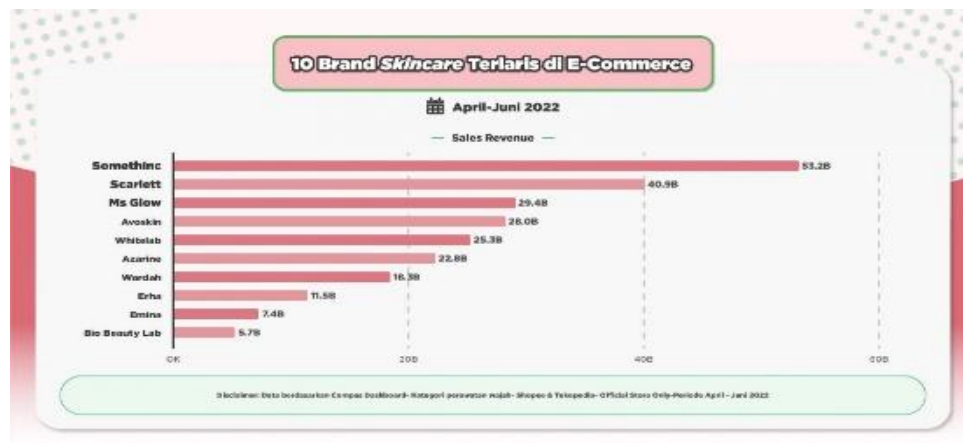
Gambar 1. Brand Skincare Lokal Terlaris di E-Commerce

Pada berkembangnya zaman, kini perawatan wajah sudah menjadi kebutuhan paling utama bagi sebagian masyarakat, dalam beberapa tahun terakhir berbagai macam produk skincare dari luar negeri dengan mudah ditemukan di Indonesia, perkembangan bisnis skincare pada masa kini sudah berkembang pesat, di antaranya banyak produk dari merek lokal bersaing di pasaran dengan menawarkan banyak pilihan dalam hal kandungan dengan segala jenis permasalahan pada kulit wajah (Hayati, 2022). Pelaku bisnis skincare terus bersaing dalam menawarkan manfaat produk untuk pengguna skincare agar menarik konsumen, semakin banyak merek skincare baru yang bermunculan maka semakin ketat pula persaingan antar pelaku usaha produk skincare tersebut. Keberagaman produk dan macam manfaat yang terus dikembangkan dalam hal kualitas produk oleh pelaku usaha skincare adalah untuk menarik lebih banyak konsumen. Dibawah ini merupakan brand lokal skincare terlaris di E-Commerce dapat dilihat pada Gambar 1 (Cuong, 2021).