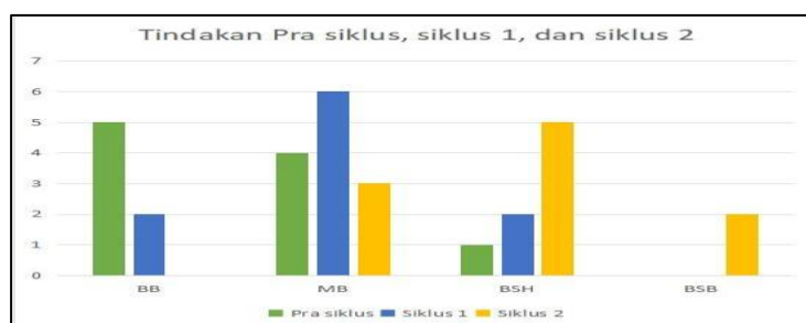
Gambar 2. Grafik Perbandingan Hasil Tindakan Pra Siklus, Siklus I, dan Siklus II

Tabel 8 menunjukkan hasil peningkatan perkembangan sosial emosional anak pada siklus II, pada pertemuan siklus I persentasi anak yang belum berkembang 2 anak (20%), mulai berkembang naik 6 anak (60%), dan berkembang sesuai harapan 2 anak (20%). Sedangkan pada siklus II persentasi anak yang mulai berkembang 3 anak (30%), berkembang sesuai harapan 5 anak (50%), berkembang sangat baik 2 anak (20%), dan tidak terdapat anak yang belum berkembang. Refleksi siklus II menggunakan metode bermainperan dibantu dengan media loose part dan puzzle hurup berhasil meningkatkan perkembangan sosial emosional anak dengan persentase sebesar 70%. berikut disajikan perbandingan hasil tindakan pra siklus, siklus I, dan siklus II pada gambar 2.